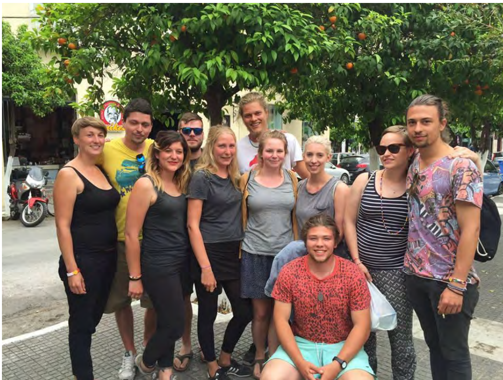
Volunteers in Athen, April 2016